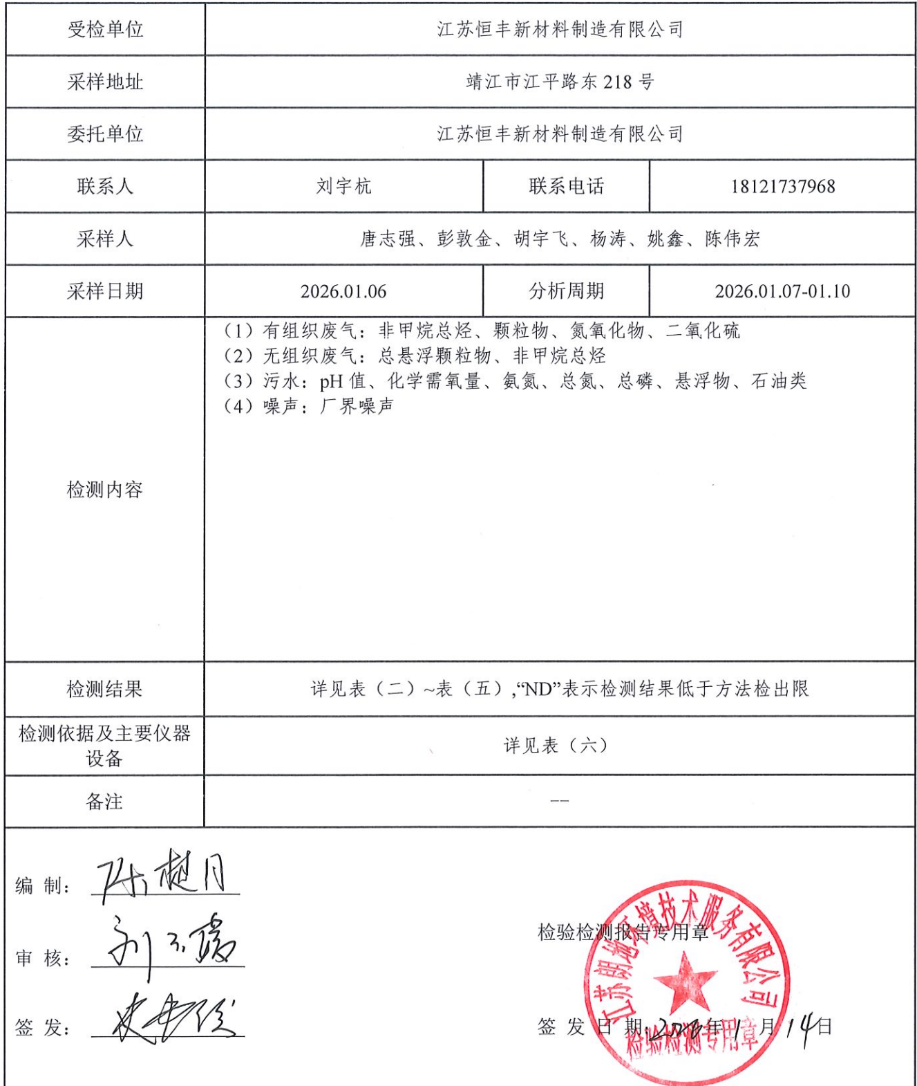
表 (一) 项目概括说明